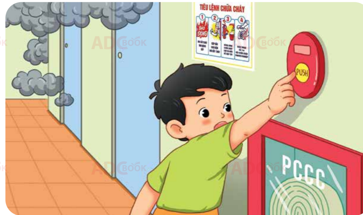
nhấn nút ấn báo cháy