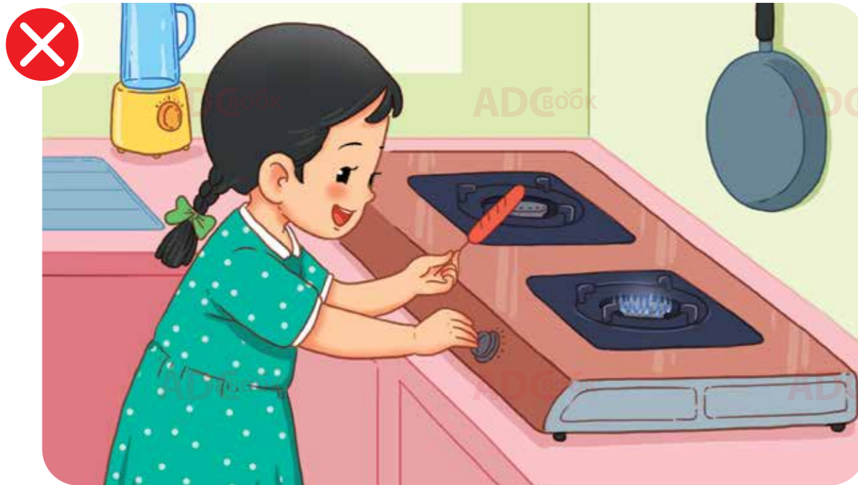
không tự ý sử dụng bếp gas