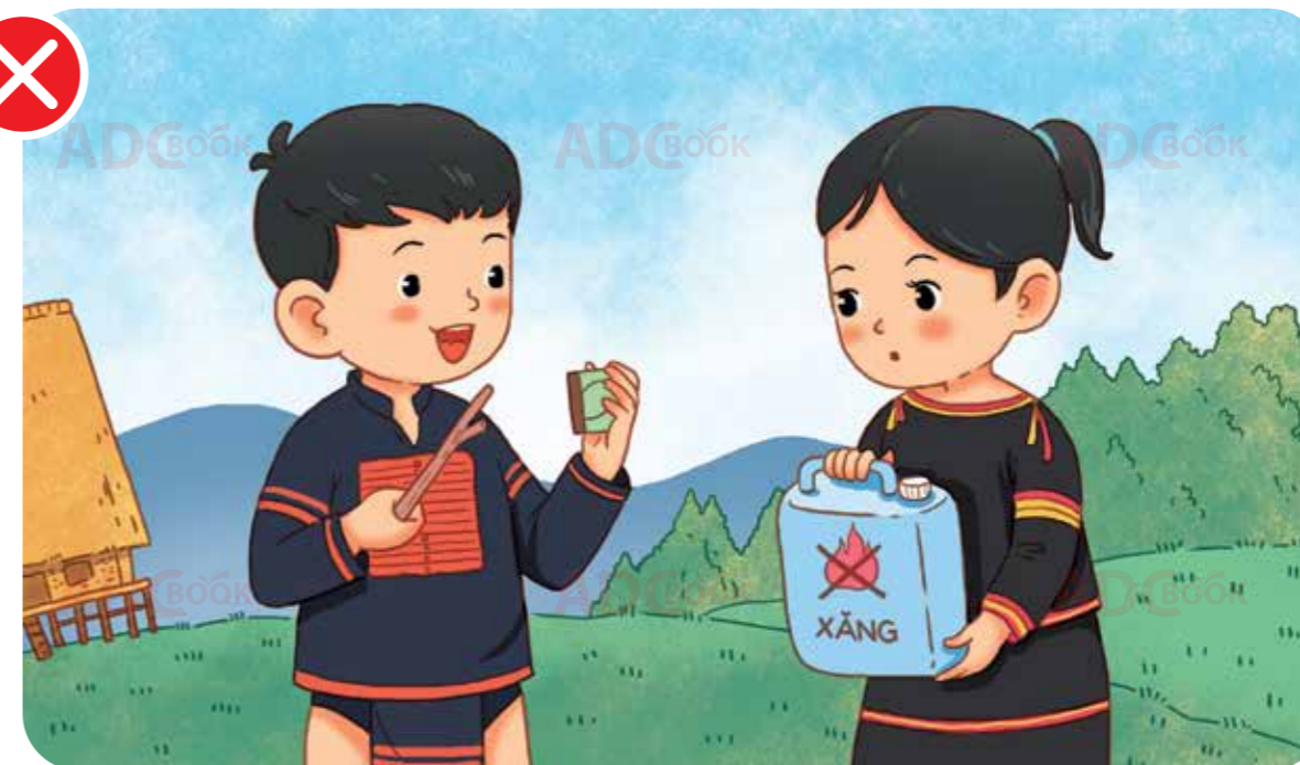
không tự ý nghịch xăng, dầu