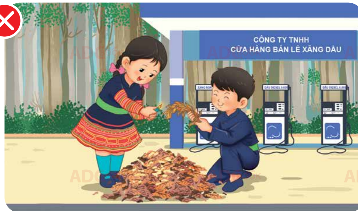
không tự ý đốt lá cây / giấy / củi / ...