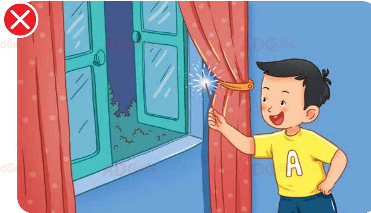
không tự ý nghịch pháo bông