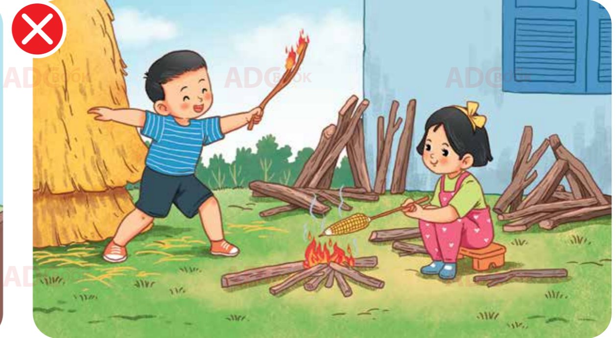
không nghịch củi đang cháy