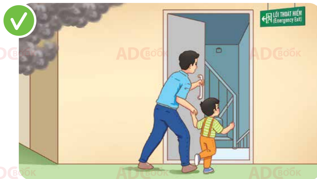
bình tĩnh đi theo cầu thang bộ trong nhà và đèn chỉ dẫn màu xanh