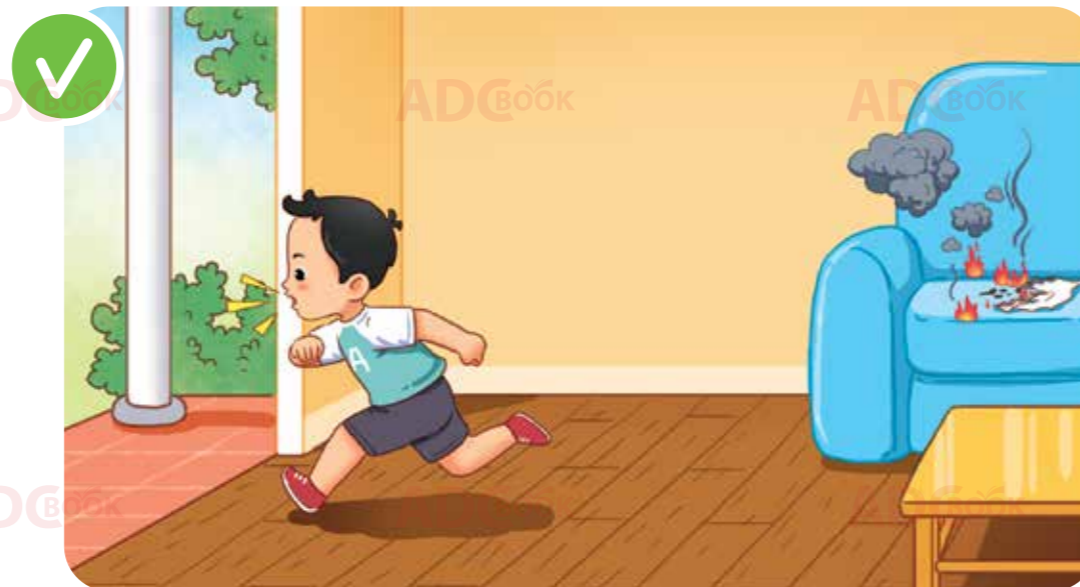
ngay lập tức thoát khỏi nơi nguy hiểm