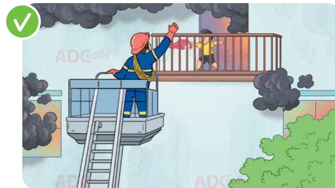
di chuyển ra ban công tìm kiếm sự trợ giúp của lực lượng chữa cháy