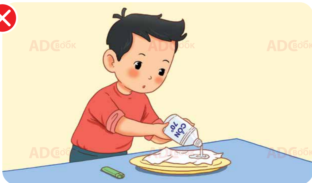
không tự ý sử dụng cồn