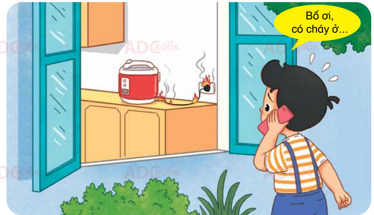
gọi điện thoại báo cho người lớn biết