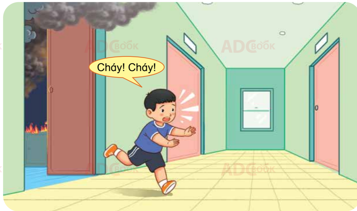
hô to, báo cho những người xung quanh biết