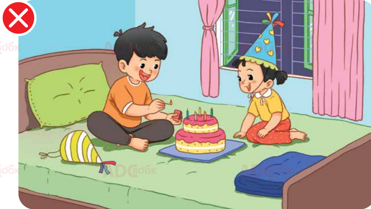
không tự ý dùng diêm, nến