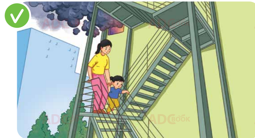
thoát hiểm bằng cầu thang bộ ngoài nhà