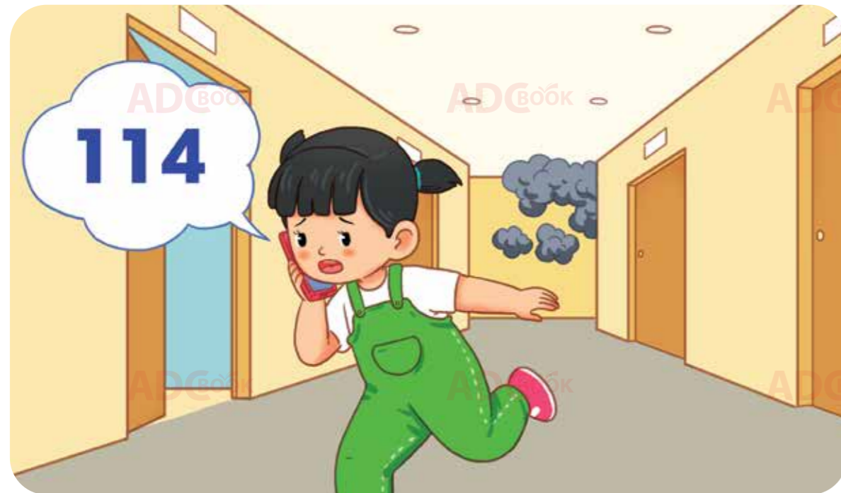
gọi số điện thoại khẩn cấp 114