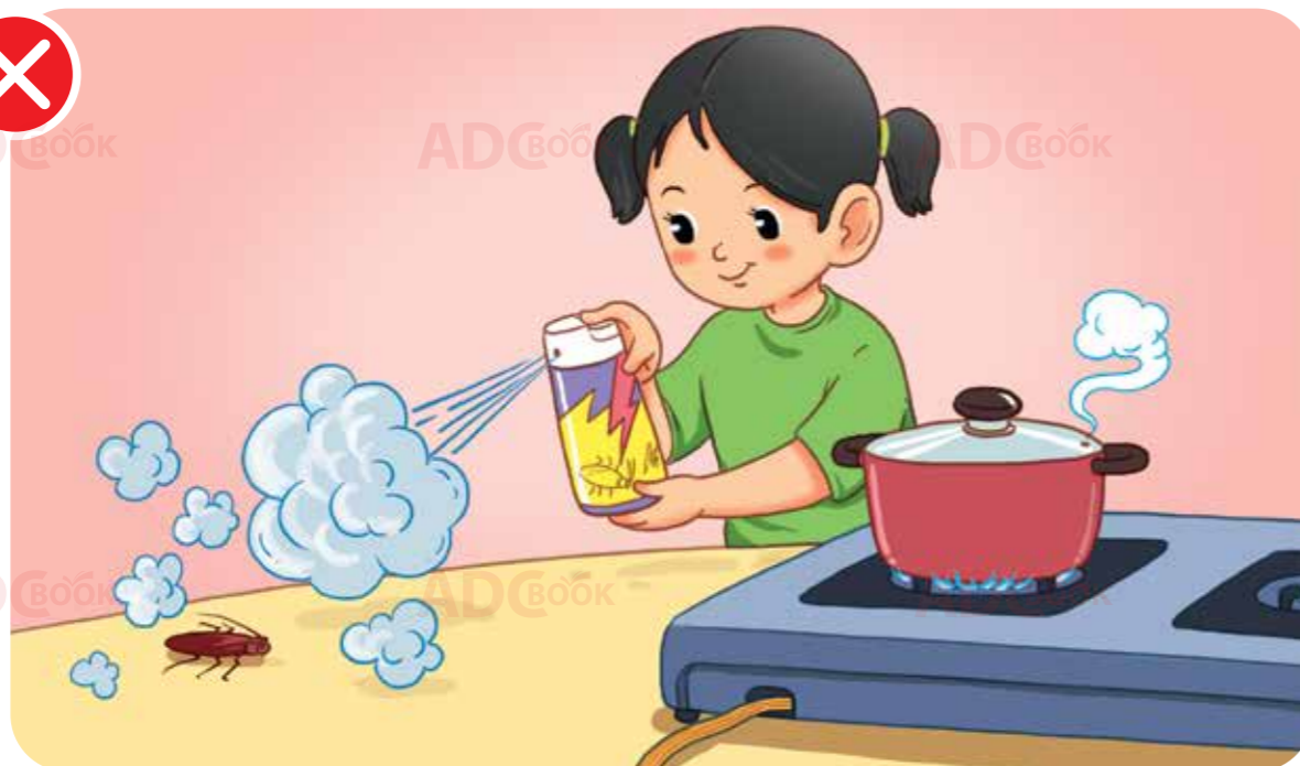
không sử dụng bình xịt côn trùng gần bếp lửa