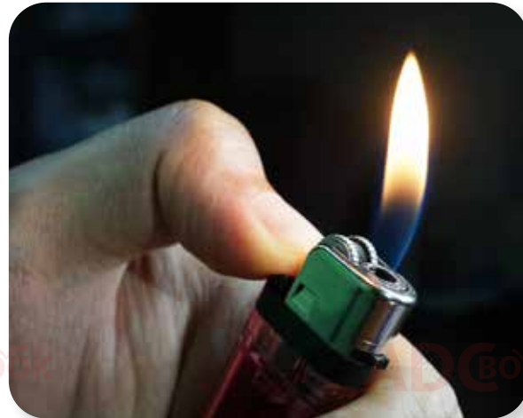
lửa từ bật lửa gas