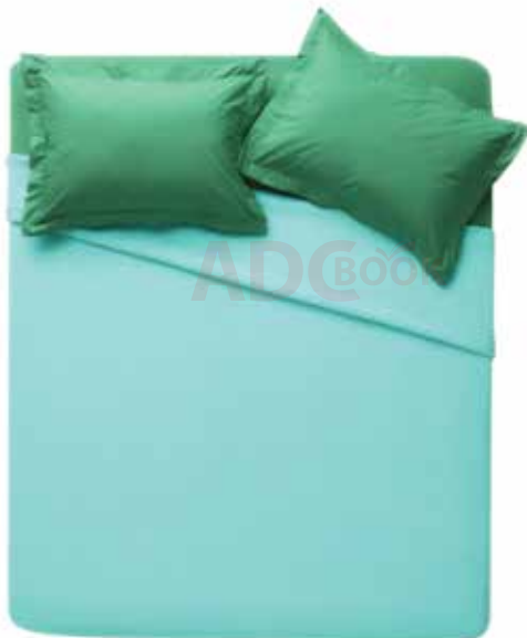
đệm mút; chăn gối bằng vải, bông