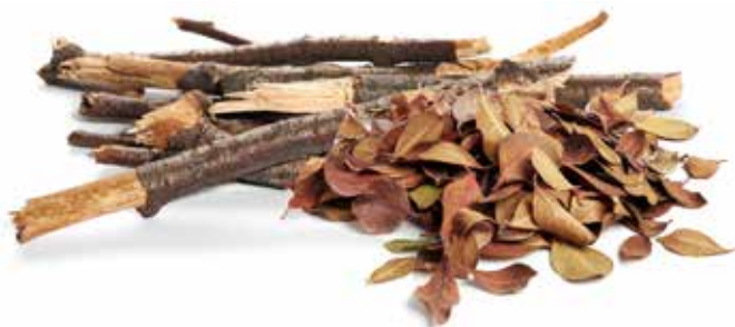
gỗ / củi, lá khô