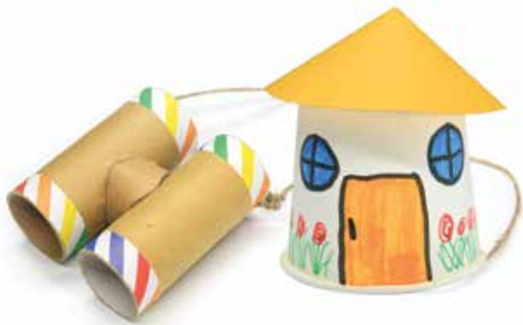
đồ chơi bằng giấy