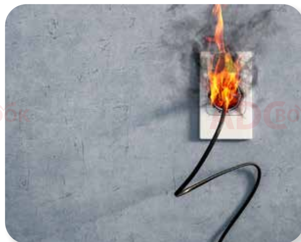
lửa do chập, cháy thiết bị điện