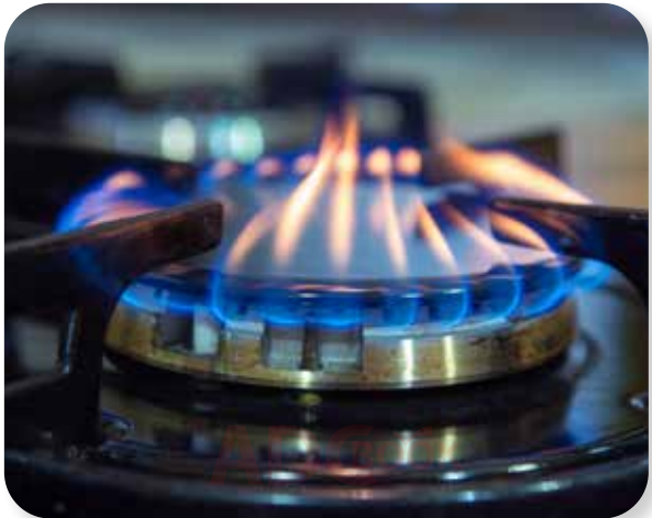
lửa từ bếp gas