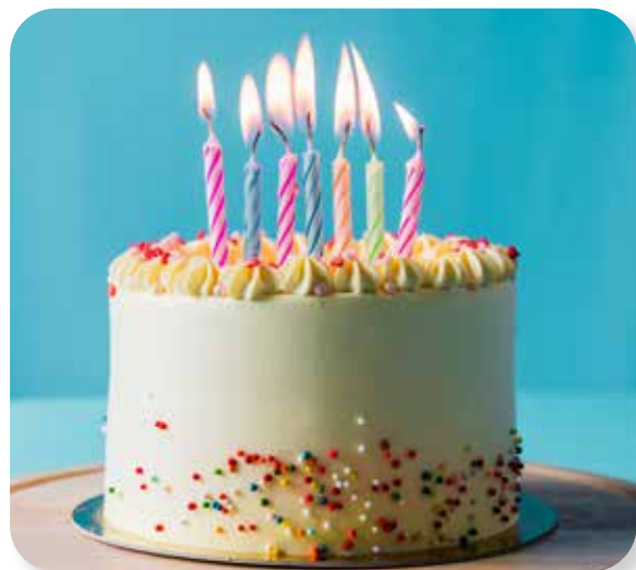
ngọn nến sinh nhật