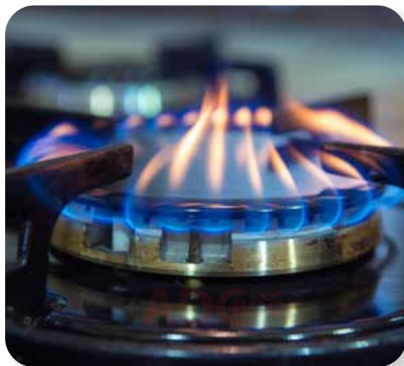
ngọn lửa bếp gas