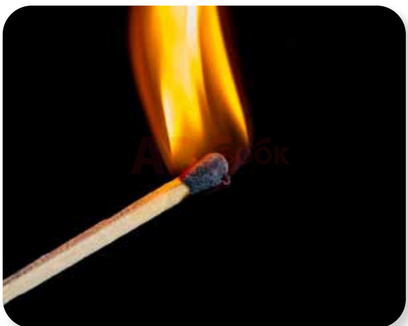
lửa từ que diêm