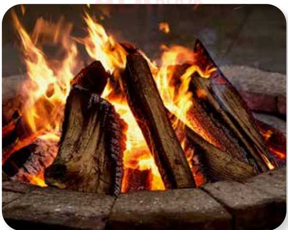
lửa từ bếp củi