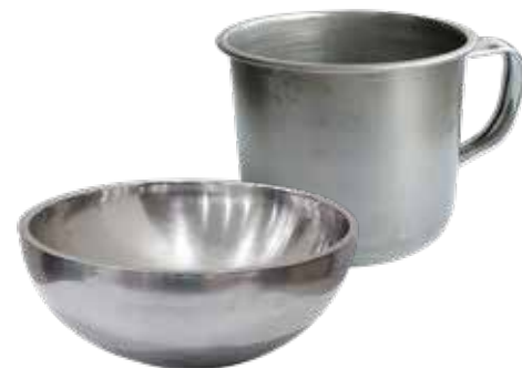
bát, cốc inox