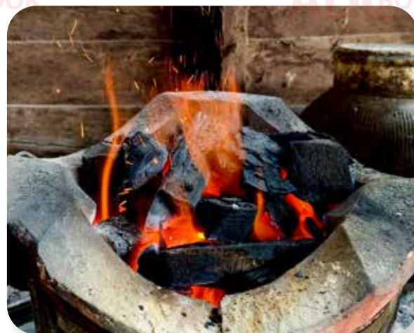
lửa từ bếp than