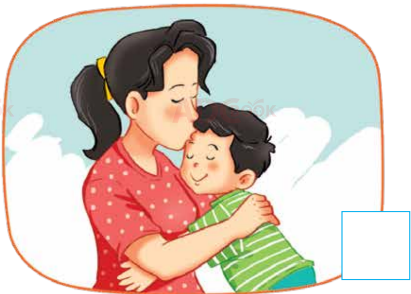
Mẹ hôn lên trán bạn Nam.