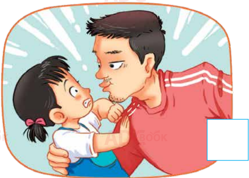
Người lạ định hôn bạn My.