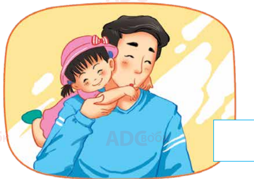
Bố hôn lên tay bạn My.