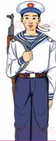
bộ đội hải quân