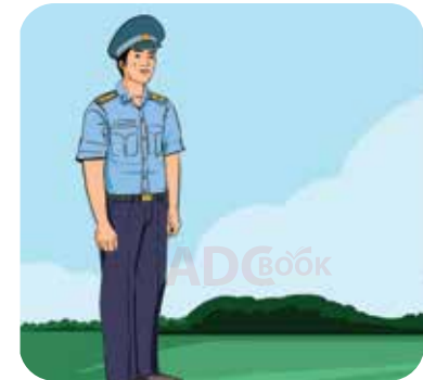
bộ đội phòng không không quân