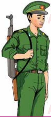
bộ đội biên phòng