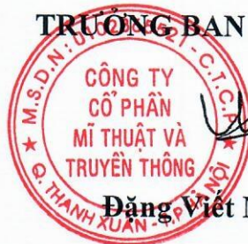
Đặng Việt Mạnh